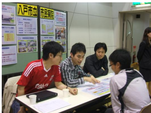
和やかな雰囲気です丁寧に説明する先輩医師