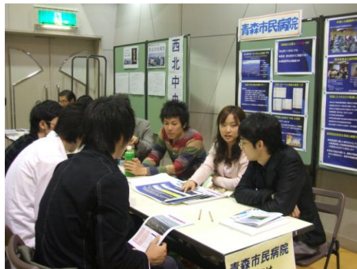
丁寧に説明する先輩医師