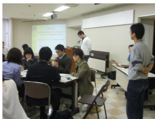
研修医によるグループワークの発表