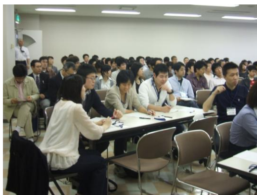
講義を聴講する研修医、医学生