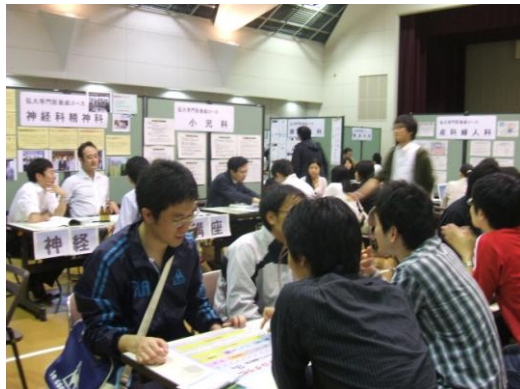
熱心に説明を聞く医学生